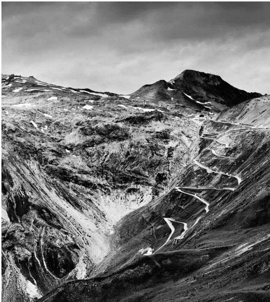
Diese Aufnahme stammt von Berthold Steinhilber aus Stuttgart und zeigt das Stilfser Joch in Südtirol.

Verwurzelt im alpinen Raum, verbunden mit unseren Kunden, vertraut mit deren Märkten. Das ist die BTV. Vier Länder. Eine Bank. Wir laden regelmäßig Fotografen dazu ein, Landschaften, Schauplätze und Menschen aus den vier Ländern zu porträtieren – ein Streifzug durch vertraute Regionen, mit anderen Augen gesehen.